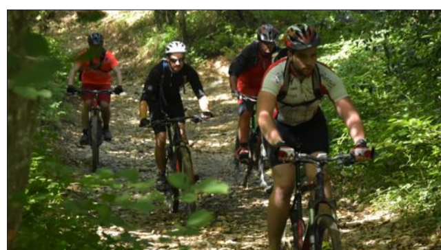
Les vététistes ont profité de l'occasion pour découvrir la région.

Dimanche était une belle journée placée sous le signe de l'amitié et de la générosité avec la 22 e édition de la randonnée organisée par l'Amicale des donateurs de sang bénévoles de Champier. Le soleil était au rendez-vous avec les 1129 participants.