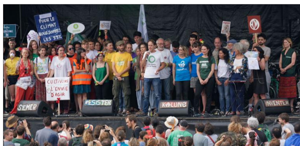
Le tour Alternatiba fera étape dans la commune vendredi.

Partis le 9 juin dernier de Paris, les participants au tour Alternatiba feront vendredi soir étape dans la commune. L'événement est à l'initiative d'Alternatiba, les Amis de la Terre et Action Non Violente COP21. Il a pour but d'alerter le grand public sur les conséquences du réchauffement climatique et de lui faire connaître les actions mises en place à l'échelon local pour amorcer la transition énergétique. Les organisateurs ont sollicité l'association Bièvre-Liers Environnement pour préparer l'accueil de l'étape. Le tour arrivera dans la commune vendredi en milieu d'après-midi. Toutes les personnes qui le souhaitent sont invi-