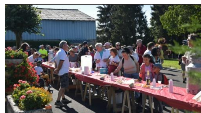
Les participants ont pu se rassasier autour du four à bois.

765 randonneurs et 364 vététistes ont pris le départ sur les différents parcours. Pour la 6 e année consécutive, le ravitaillement se faisait autour d'un four à bois qui était situé cette année aux Effeuillets. Tous les participants ont félicité les organisateurs pour la